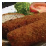
Basic € 7,00 p.p.