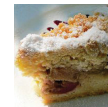
Appelgebak € 3,00 p.p.