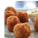
Bittergarnituur € 2,00 p.p.