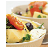
Tapasbuffet € 24,50 p.p.