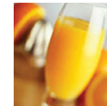
Healthy € 12,50 p.p.