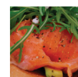
Business € 25,50 p.p.