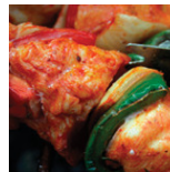
BBQ Premium € 18,50 p.p.