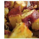
BBQ Superior € 28,00 p.p.