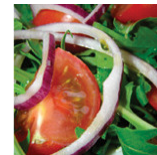
BBQ DeLuxe € 25,00 p.p.