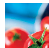
Basic € 17,50 p.p.