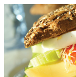
Easy € 11,00 p.p.