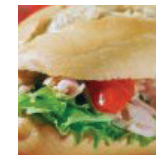
Best € 9,00 p.p.