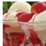
Desserts v.a.€ 5,00 p.p.