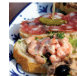
Pinchos v.a.€ 2,00 p.p.