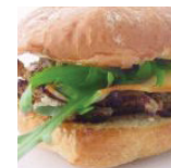
Basic Extra € 9,00 p.p.