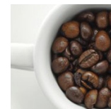
Koffie/thee € 2,00 p.p.